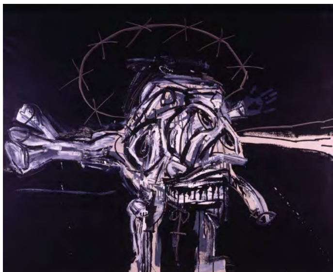
Antonio Saura / Crucifixión, 1959