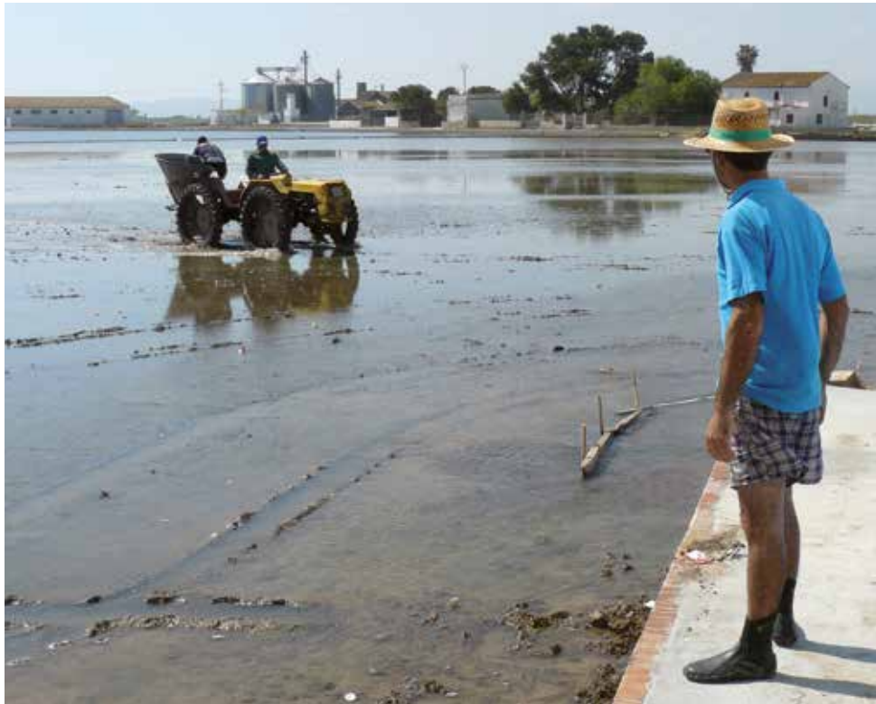
La sembra primerenca tradicional —preferiblement, entre finals d'abril i principis de maig—, immediatament a continuació de la solta de l'aigua, evita en certa mesura el desenvolupament de males herbes, algues i algunes plagues.