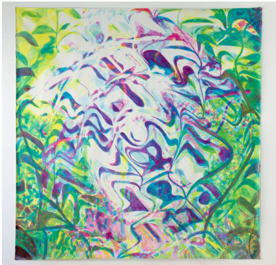
El velo de Maya , 2017. FEDERICO GUZMÁN

Parmènides. Les parets estan pintades amb un fons negre pissarra i dibuixos de guix, a manera de cova, sobre les quals es despleguen 8 llenços, obra sobre paper de gran format i una sèrie específica de linotips que il·lustren el poema presocràtic.