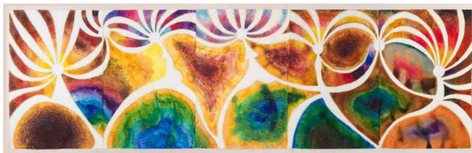
Heliades (las hijas del Sol) , 2017. FEDERICO GUZMÁN

La planta superior de la galería 6 del IVAM, concebida como una obra específica, acoge el mural colectivo Posidonia Oceánica realizado en colaboración con inmigrantes de Sevilla Acoge y con estudiantes de la Facultad de Bellas Artes de la Universitat Politècnica de València. El mural visualiza las praderas submarinas de