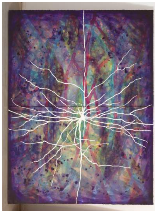
El rayo que no cesa , 2017. FEDERICO GUZMÁN

otro en desafío , Universidad del Atlántico, Barranquilla. Ha publicado textos como The Art of Sahrawi Cooking , en el marco de DOCUMENTA (13), Kassel (con Robin Kahn), o para el libro Destrucción y construcción del territorio IV , de la Universidad Complutense, Madrid. Tuiza, en Provincia 53. Arte, territorio y descolonización del Sáhara , para el MUSAC de León, ha sido uno de sus últimos proyectos.