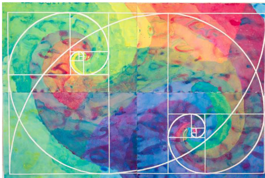
Aletheia (la verdad) , 2017. FEDERICO GUZMÁN