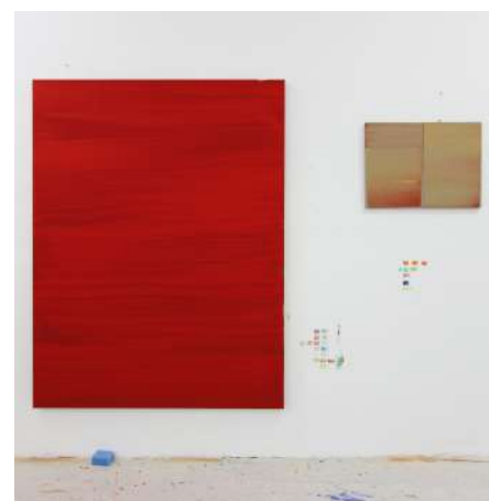
Praecisio. Montaje en estudio, 2017.. Nico Munuera