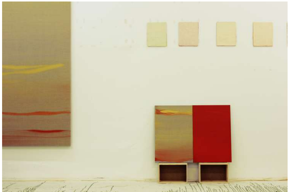
Praecisio. Montaje en estudio, 2017. Nico Munuera

19 octubre 2017 - 14 gener 2018 Galeria 6 IVAM Centre Julio González Comissariat: Nico Munuera