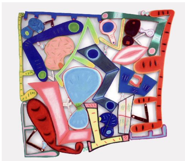
The Lowdown (2001), Elizabeth Murray

Peter Halley, Albert Oehlen, Terry Winters, Per Kirkeby o James Turrell. També inclou obres de pintors i escultors espanyols que van habilitar un espai per a la modernitat com Esteban Vicente, Jorge Oteiza, Pablo Palazuelo, Equipo 57, grupo Parpalló, Soledad Sevilla, Elena Asins, José María Yturralde, Manuel Barbadillo, grupo El Paso, Antonio Saura, Juana Francés, Antoni Tàpies, Ángeles Marco, Luis Gordillo, José María Sicilia o Jordi Teixidor.