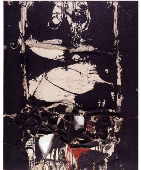
cuadro 65 (1959), Manuel Millares