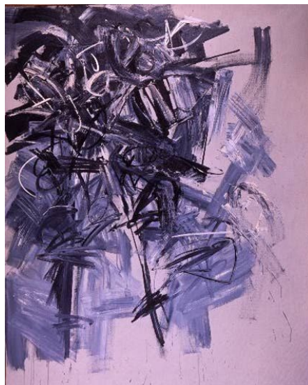
Clara (1956), Antonio Saura

L'exposició també reflexiona sobre els efectes que les revolucions socials van provocar sobre les pràctiques artístiques amb l'aparició de l' art conceptual i les crítiques sobre el