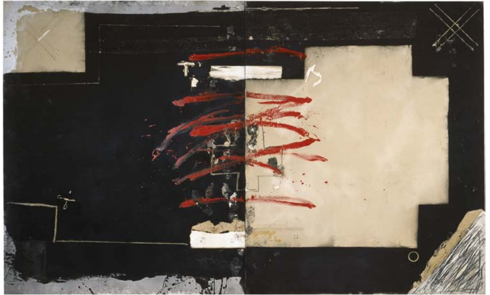
Gran díptic roig i negre (1980), Antoni Tàpies

L'exposició que presenta l'IVAM reuneix vora 150 obres de la Col·lecció del museu amb l'objectiu d'analitzar les pràctiques artístiques de caràcter abstracte desenvolupades des de la postguerra fins a finals del segle XX. La mostra recorre temàtica i cronològicament la gran evolució patida per les diferents tendències artístiques a partir del final de la Segona Guerra Mundial, des de l'emotivitat continguda en els grans llenços fins a la tactilitat de la visió advertida en les instal·lacions artístiques.