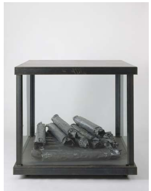
Sweets (1991), Susana Solano

La exposició que presenta el IVAM reuneix cerca de 150 obres de la Colección del museo con el objetivo de analizar las prácticas artísticas de carácter abstracto desarrolladas desde la posguerra hasta finales del siglo XX. La muestra recorre temática y cronológicamente la gran evolución sufrida por las distintas tendencias artísticas a partir del final de la Segunda Guerra Mundial, desde la emotividad contenida en los grandes lienzos hasta la tactilidad de la visión advertida en las instalaciones artísticas.