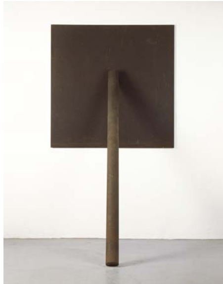
1577 (1968), Richard Serra

una frase de Charles Baudelaire: “Tant la línia com el color inspiren pensaments i somnis; els plaers que deriven d'ells són de naturalesa diferent, encara que perfectament iguals i absolutament independents del tema de la pintura”. Seguint les idees de l'escriptor francès, la mostra presenta a un conjunt d'artistes que entenen la línia i el color com a elements d'un llenguatge plàstic equivalent a la funció que la paraula i la frase juguen en el llenguatge escrit o parlat . Un llenguatge que tracta, no tant, de descriure o de narrar una situació específica com de produir sensacions, experiències o emocions.