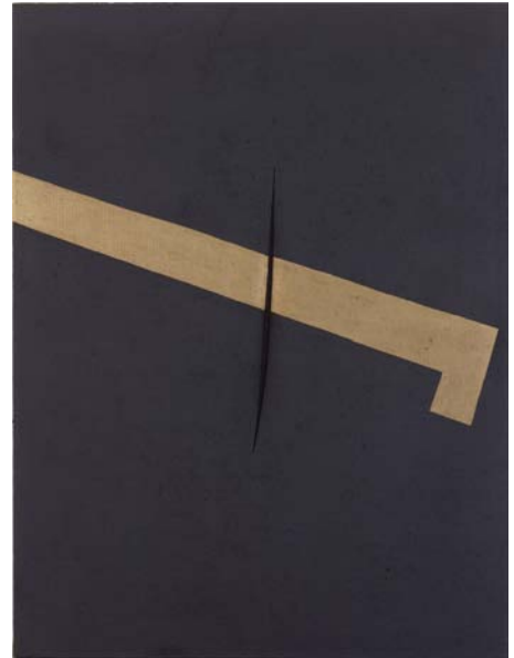
Crucifixión (1959), Lucio Fontana