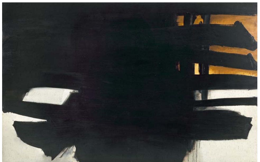
Peinture, 11 juillet 1965 (1965), Pierre Soulages

El título de la exposición, Línea y color en la Colección del IVAM , hace referencia a una frase de Charles Baudelaire: “Tanto la línea como el color inspiran pensamientos y sueños; los placeres que derivan de ellos son de naturaleza distinta, aunque perfectamente iguales y absolutamente independientes del tema de la pintura”. Siguiendo las ideas del escritor francés, la muestra presenta a un conjunto de artistas que entienden la línea y el color como elementos de un lenguaje plástico equivalente a la función que la palabra y la frase juegan en el lenguaje escrito o hablado . Un lenguaje que trata, no tanto, de describir o narrar una situación específica como de producir