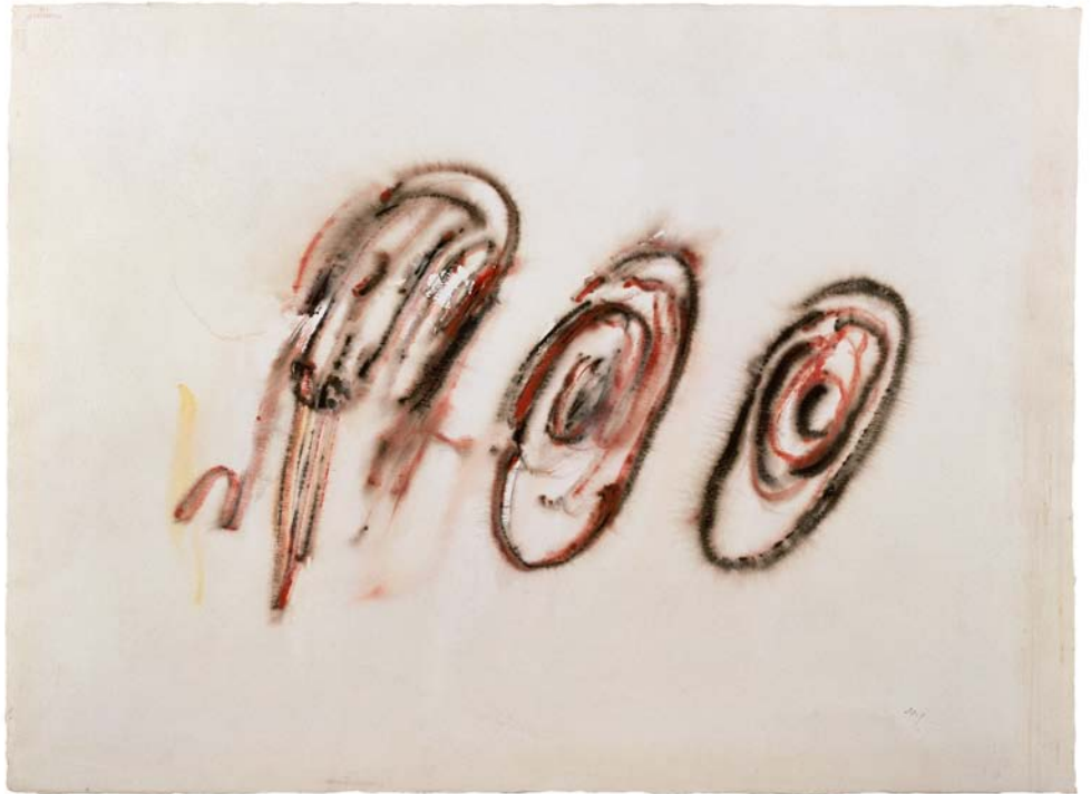
Sin título (1956), Henri Michaux