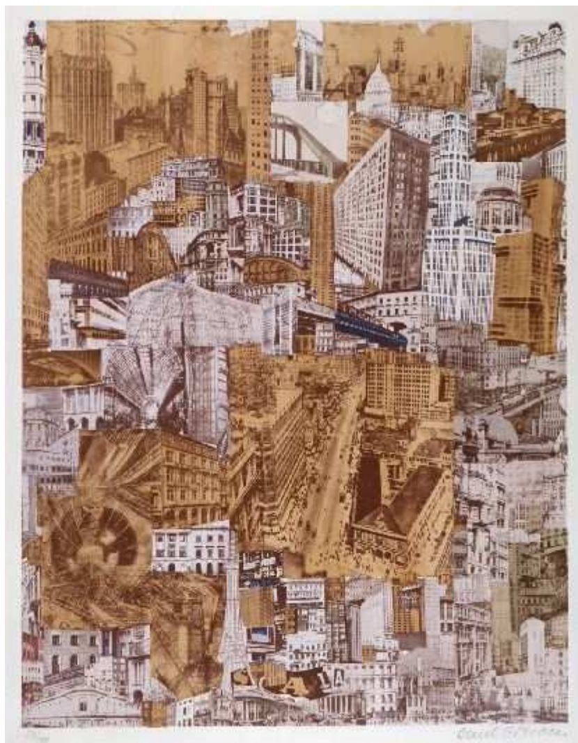
Metropolis , 1923. Paul Citroen. IVAM