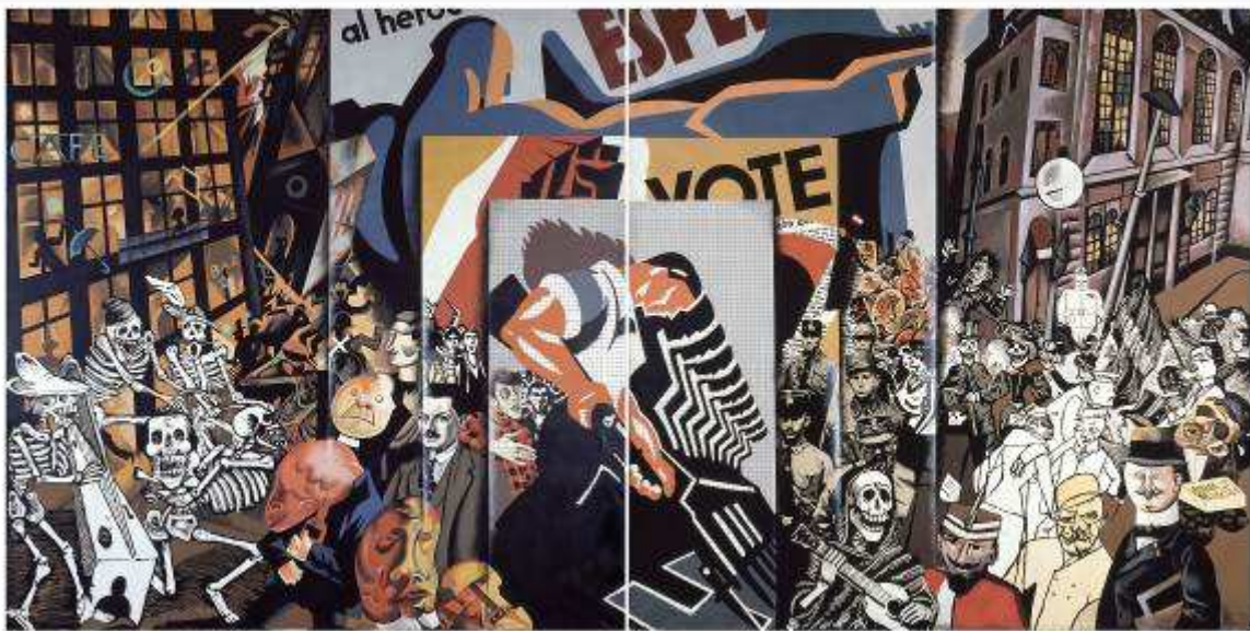
El panfleto , 1973. Equipo crónica. IVAM

Los habitantes de estas grandes metrópolis también sirven de fuente de inspiración a artistas como Robert Doisneau (1912-1994), Sergio Larrain (1931-2012), Ramón Masats (1931) o George S. Zimbel (1929), que buscan historias de individuos y multitudes. Fotógrafos como Agustí Centelles (1909-1985) o Kineo Kuwabara (1913-2007) relatan el papel de los ciudadanos en los principales hechos históricos.