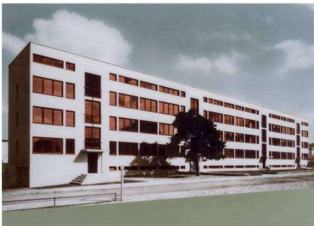
W.H.S. 02, 2002. Thomas Ruff. IVAM. Depósito Cal Cego