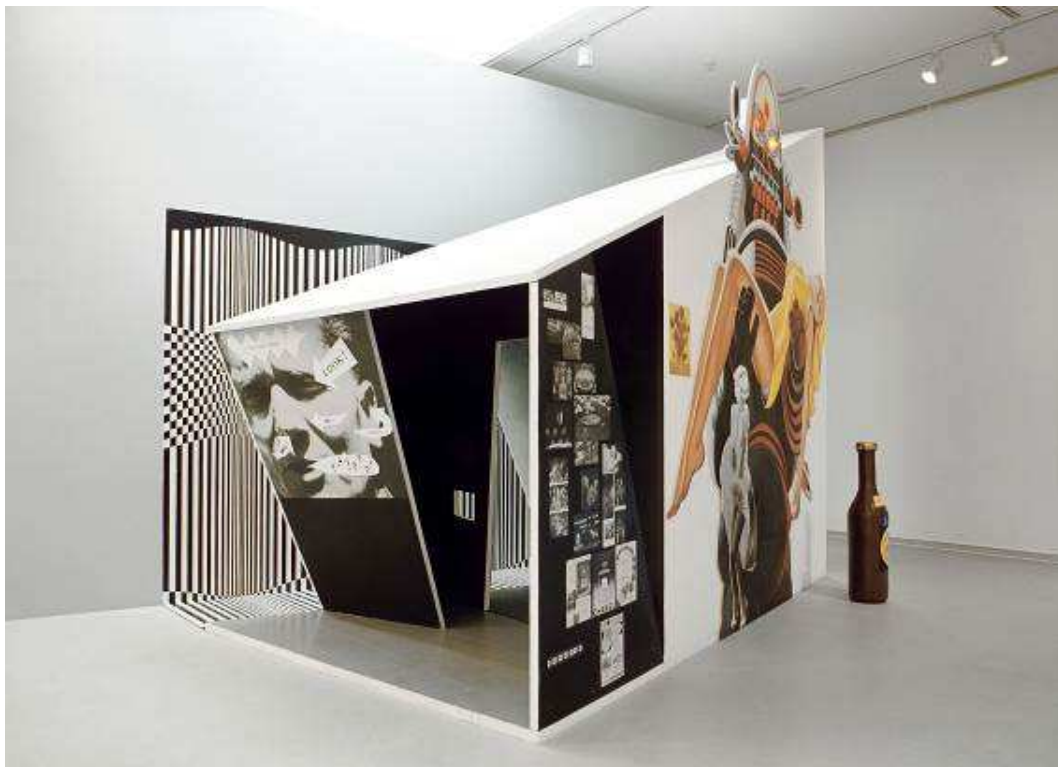
Fun House, 1956. Richard Hamilton.

A través de este extenso recorrido, que incluye fragmentos de películas como Just Image , 1930, de David Butler ; Skyscraper Symphony , 1929, de Robert Florey ; In the Street , 1948, de Helen Levitt ; Empire , 1964, de Andy Warhol y Splitting , 1970, de Gordon Matta Clark , pasamos de una gran celebración de las metrópolis, en el que la ciudad era la más clara manifestación de la modernidad, al desencanto que se materializa en la expresión de los miedos, la soledad, el control o la vigilancia.