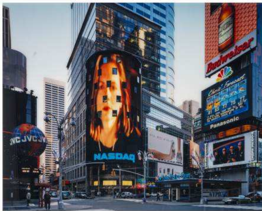
Times Square N.Y. 2000. Thomas Struth. IVAM. Depósito Cal Cego

En esta quinta sala pueden verse los edificios fotografiados por Gabriele Basilico (1944-2013), o el inventario de construcciones industriales de Bernd y Hilla Becher (1931-2007/1961-2007). Estos últimos fotógrafos alemanes recogen el espíritu documental y taxonómico de la obra, además de la obsesión minimalista por el serialismo y la pulcritud del objeto estético.