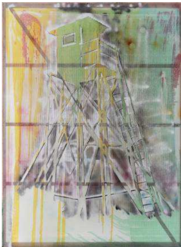
Torre de vigilancia , 1984. Sigmar Polke. IVAM

Antoni Muntadas (1942) ha sido uno de los artistas que ha analizado de forma específica los espacios arquetípicos del poder. En Stadium I-XV , 1989-2011, critica la política de tener entretenido al pueblo para suprimir la protesta y conseguir la paz social.