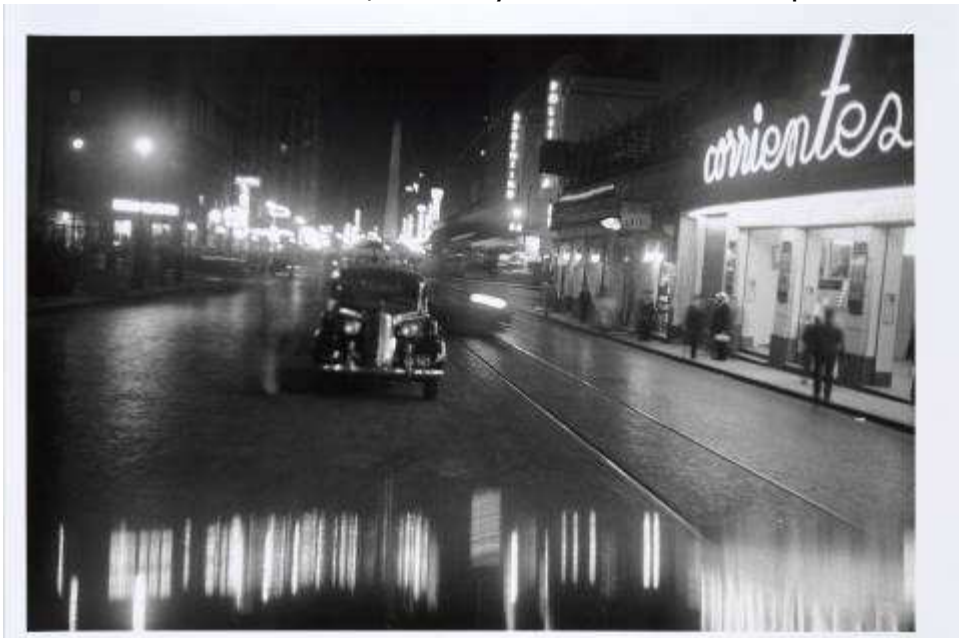
Corrientes esquina Uruguay, 1936.

Horacio Coppola (1906-2012) crea decenas de imágenes en las que da cuenta del espíritu de Buenos Aires desde un punto de vista vanguardista, mostrando una ciudad moderna, abierta y ávida de nuevas experiencias.