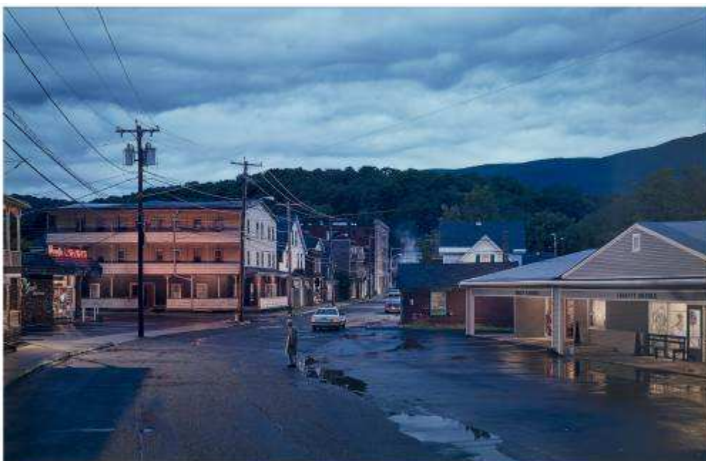
Untitled (Oasis) , 2004. Gregory Crewdson. IVAM. Depósito Cal Cego

Artistas como Anzo (1931-2006) y Juana Francés (1924-1990) y, posteriormente, Juan Muñoz (1953-2001), desarrollan trabajos reflexivos y críticos respecto a la condición existencial del ser humano frente al progreso industrial y tecnológico. En su obra Aislamiento 7 , 1967, Anzo hace hincapié en la pérdida de sentido y de identidad de la persona descontextualizándolo, representándolo como un asceta en perfecta comunión con la mecanización, la industrialización y la vida en las oficinas. Juana Francés produce su serie El hombre y la ciudad , 1963, describiendo un entorno angustioso y agobiante, dominado por la incomunicación, la alienación y la continua transformación del hombre en máquina. Los personajes monocromos de rasgos impersonales de Juan Muñoz , como la escultura Chino frotándose las manos , 1995, analizan el aislamiento y la carencia de comunicación.