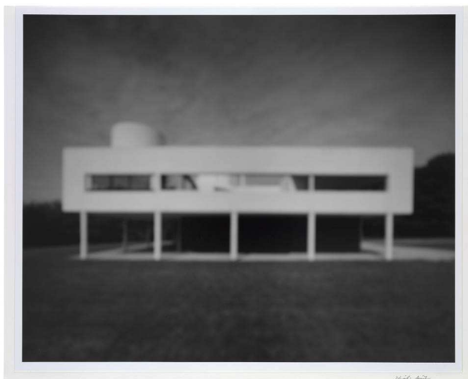
Villa Saboya , 1998. Hiroshi Sugimoto. IVAM. Depósito Cal Cego

En la serie de pinturas de paisajes urbanos nocturnos a la que pertenece Wet Evening , 1986, Alex Katz (1927) es capaz de articular el silencio, el inconsciente, la melancolía y la laxitud de las normas durante la noche.