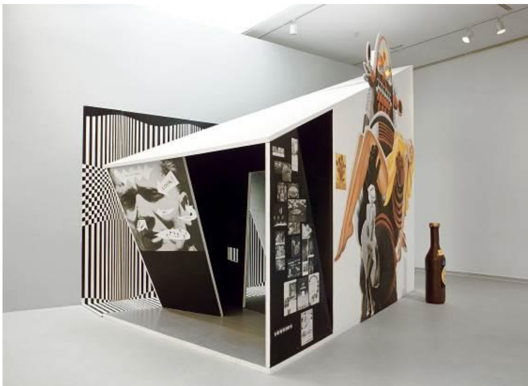
Fun House, 1956. Richard Hamilton.

A través d'aquest extens recorregut que inclou fragments de pel·lícules com Just Image , 1930, de David Butler , Skyscraper Symphonie , 1929, de Robert Florey ; In the Street , 1948, de Helen Levitt ; Empire , 1964, de Andy Warhol i Splitting , 1970, de Gordon Matta Clark , passem d'una gran celebració de les metròpolis, en el qual la ciutat era la més clara manifestació de la modernitat, al desencantament que es materialitza en l'expressió de les pors, la solitud, el control o la vigilància.