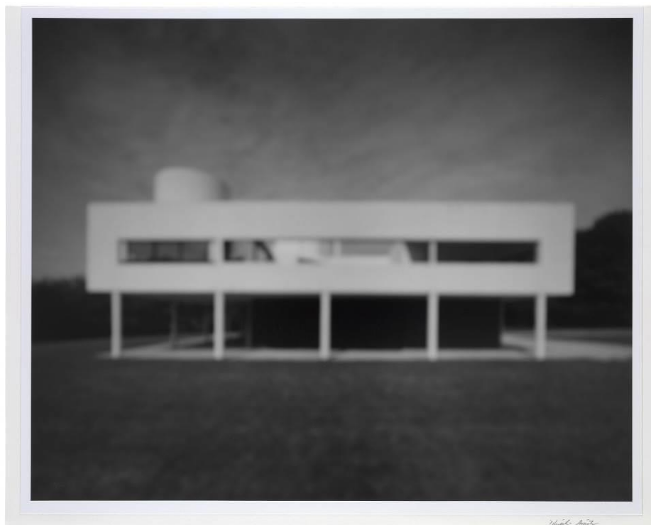
Villa Savoye , 1929. Le Corbusier. IVAM. Dipòsit Cal Cego

En la sèrie de pintures de paisatges urbans nocturns a la qual pertany Wet Evening , 1986, Alex Katz (1927) és capaç d'articular el silenci, l'inconscient, la malenconia i la laxitud de les normes durant la nit.