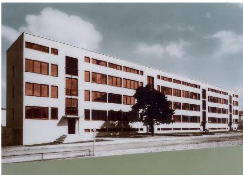
W.H.S. 02, 2002. Thomas Ruff. IVAM. Dipòsit Cal Cego