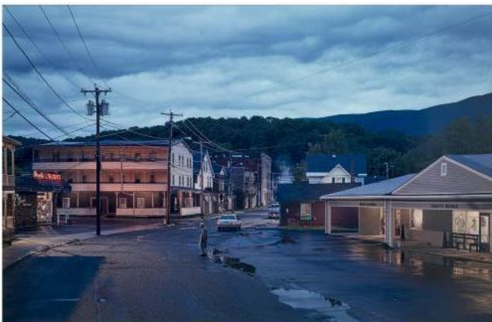
Untitled (Oasis) , 2004. Gregory Crewdson. IVAM. Dipòsit Cal Cego

Artistes com ara Anzo (1931-2006) i Juana Francés (1924-1990) i, posteriorment, Juan Muñoz (1953-2001), desenvolupen treballs reflexius i crítics respecte a la condició existencial de l'ésser humà enfront del progrés industrial i tecnològic. En la seua obra Aislamiento , 1967, Anzo posa l'accent en la pèrdua de sentit i d'identitat de la persona descontextualitzant-lo, representant-lo com un asceta en perfecta comunió amb la mecanització, la industrialització i la vida en les oficines. Juana Francés produeix la seua sèrie El hombre y la ciudad , 1963, descobrint un entorn angoixant i aclaparador, dominat per la incomunicació, l'alienació i la contínua transformació de l'home en màquina. Els personatges monocroms de trets impersonals de Juan Muñoz , com l'escultura Chino frotándose las manos , 1995, analitzen l'aïllament i la carència de comunicació.