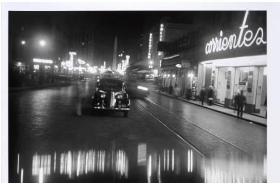
Corrientes esquina Uruguay, 1936. Horacio Coppola. IVAM

Horacio Coppola (1906-2012) crea desenes d'imatges en les quals adona de l'esperit de Buenos Aires des d'un punt de vista avantguardista, mostrant una ciutat moderna, oberta i àvida de noves experiències.