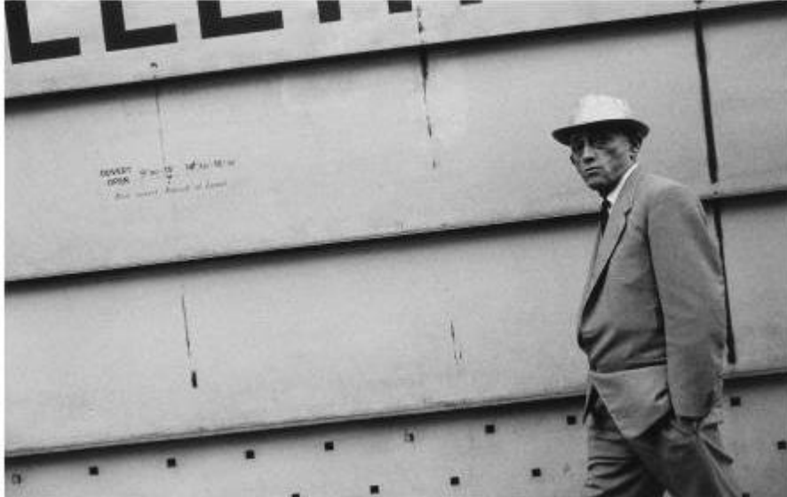
Rue de la Paix, Paris, 1962. Gabriel Cualladó. IVAM

entre 1993 i 1994 realitza Recorridos fotográficos por Arco 94 i Puntos de vista de la colección Thyssen-Bornemisza .