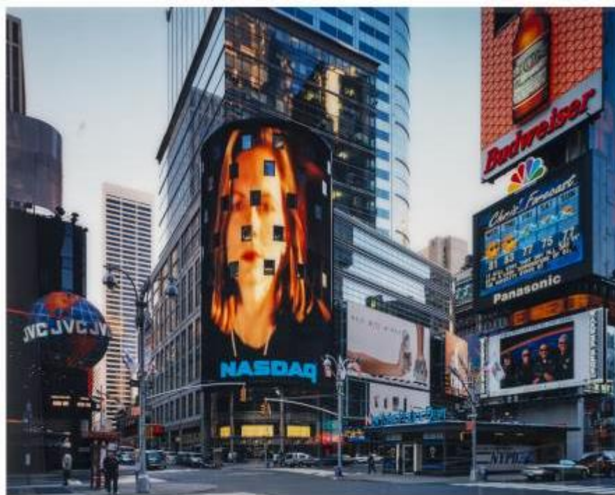
Times Square N.Y. 2000. Thomas Struth. IVAM. Dipòsit Cal Cego

En aquesta cinquena sala poden veure's els edificis fotografiats per Gabriele Basilico (1944-2013), o l'inventari de construccions industrials de Bernd y Hilla Becher (1931-2007/1961-2007). Aquests últims fotògrafs alemanys arrepleguen l'esperit documental i taxonòmic de l'obra, a més de l'obsessió minimalista pel serialisme i la netedat de l'objecte estètic.