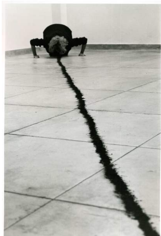
Dentro de mim (Dins de mí), 1995-1998. Helena Almeida

Als 80 i 90, introdueix un canvi en el format i l'escala de la figura humana en els seus treballs, quasi a grandària real, reduint els seus moviments i la seua expressió a un contorn negre o a una ombra, com en els dibuixos i les fotografies de la sèrie Dentro de mim (Dins de mí) , 1995-1998). Ací la figura humana marca la seua presència i projecta la seua ombra davall la forma d'un espès pigment negre que traça diagonals en l'espai buit del seu estudi.