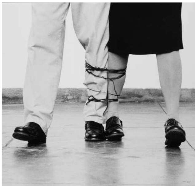
Untitled (Sense títol), 2010. Helena Almeida

Després de casar-se amb l'escultor Artur Rosa, Almeida rep una beca i es trasllada a viure a París. Exposava la seua obra per primera vegada en 1967. En els inicis, els seus treballs tridimensionals revelen les diferents influències i socaven els conceptes traidicionals de la pintura. A partir de 1969, l'artista comença a treballar en la noció d'auto-representació. Segons Almeida no hi ha límits entre el treball i el cos de l'artista. Tot i això, les seues obres no són autoretrats, sinó que basculen entre la performance, capturant un moment fixe en el temps, i l'art corporal, on el seu propi cos és el tema de l'obra.