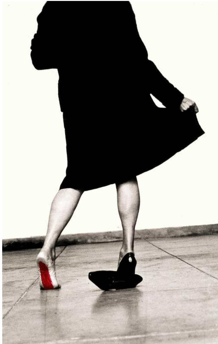
Seduzir . 2002. Helena Almeida. Fundación Calouste Gulbenkian