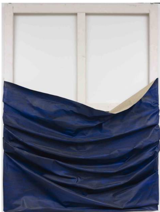
Sense títol , 1969 Helena Almeida

Des dels inicis de la seua carrera, Almeida va introduir en les seues pintures abstractes les preocupacions centrals que defineixen la seua pràctica artística: el desig de transcendir els límits de l'espai pictòric i narratiu. La seua sèrie de llenços sense títol dels anys 1968-1969 mostren el seu procés de desconstrucció dels suports artístics tradicionals i del llenguatge de la pintura.