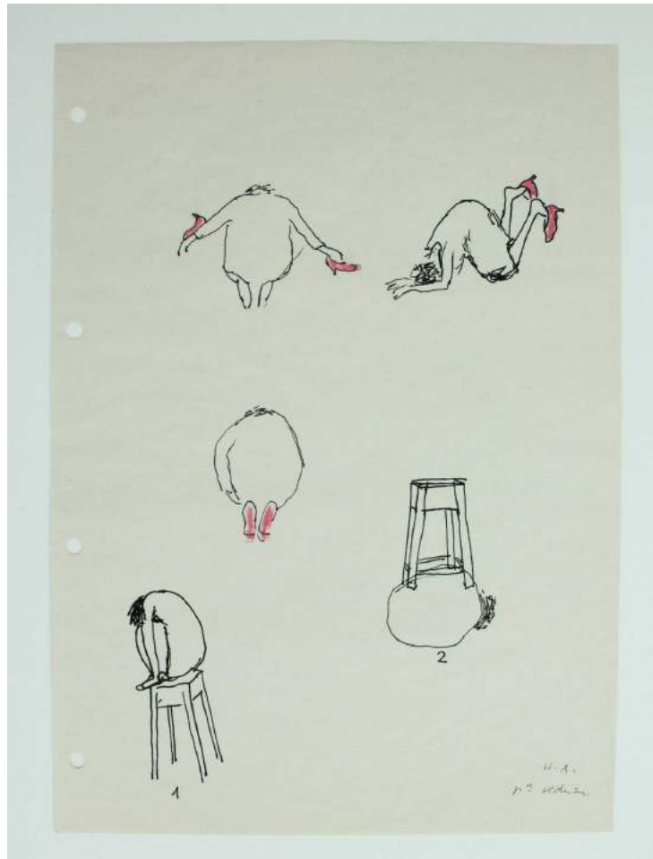
Seduzir 2001-2002 Helena Almeida

Més que sobre l'expressió de la cara, Almeida concentra l'atenció de l'espectador sobre els elements aïllats del cos: el poder expressiu d'una mà en moviment o d'una cama en tensió, o l'estranya geometria dels cossos en contacte amb l'ambient que els envolta.