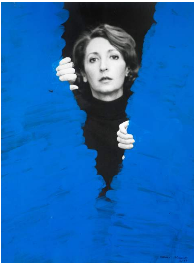
Pintura Habitada 1976- 1977 Helena Almeida