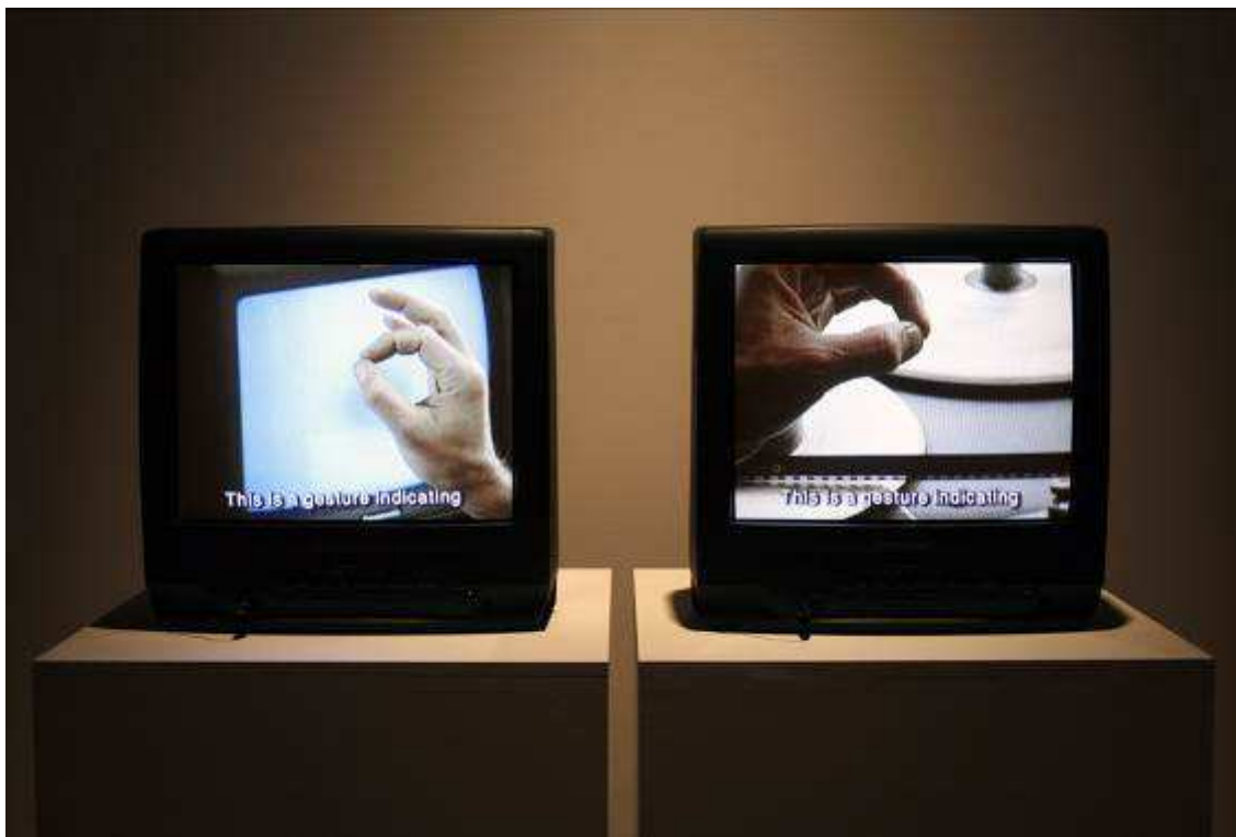
Harun Farocki. Interface , 1995

Aquesta exposició retrospectiva, comissariada per Antje Ehmman i Carles Guerra , mostra per primera vegada a Espanya una àmplia selecció de pel·lícules del cineasta alemany Harun Farocki , un dels majors exponents del cinema d'assaig, autor d'una important obra com a director de cinema, videoartista i crític de cinema. La mostra inclou algunes de les seues videoinstal·lacions més destacades, com ara Eye / Machine I (2000) i Eye / Machine II (2001), Serious Games I-IV (2010), Parallel I-IV (2012-2014), The Creators of Shopping Worlds (2001), I thought I was Seeing Convicts (2000) i Interface (1995). Tot açò acompanyat d'un doble programa de pel·lícules: un dedicat a recuperar els programes de televisió en els quals l'artista retrata a altres artistes i intel·lectuals, i un altre a través del com es pot traçar l'evolució d'un gènere molt específic l'objecte del qual seria la crítica de la imatge.