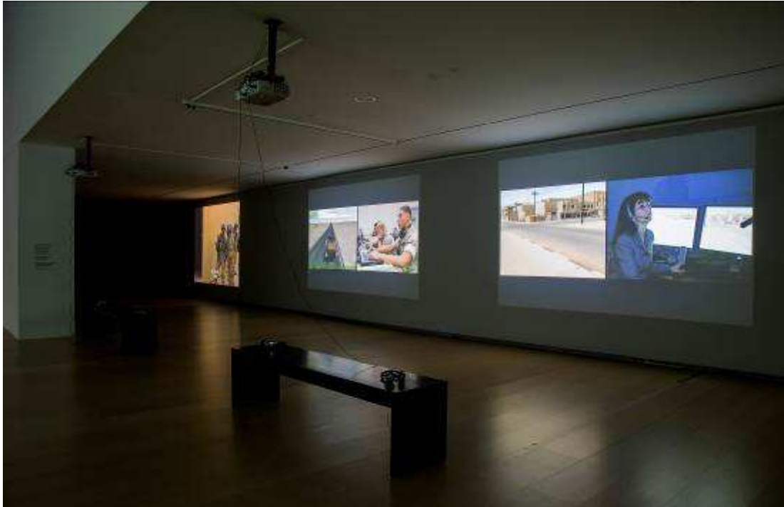
Harun Farocki. Serious Games I-IV , 2010

psicològic dels soldats que pateixen estrès posttraumàtic en tornar de les missions de combat.