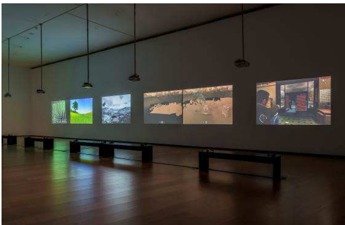
Harun Farocki. Parallel I-IV, 2012-2014