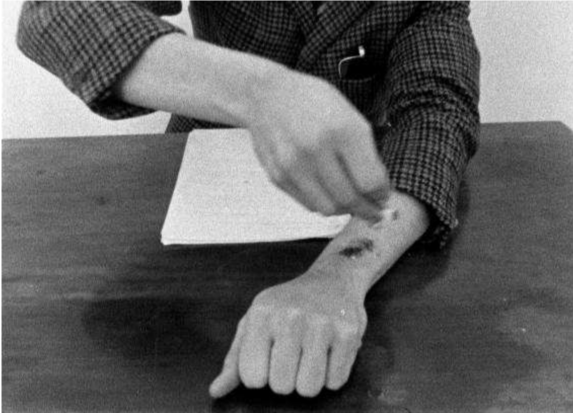
Harun Farocki. Inextinguishable Fire , 1969, 25'

La mostra arranca amb sis curtmetratges dels inicis de la producció del cineasta: Everybody a Berliner Kindl (1966), The Campaign Volunteer (1967), The Words of the Chairman (1967), Their Newspapers (1968), White Christmas (1968) i Inextinguishable Fire (1969).