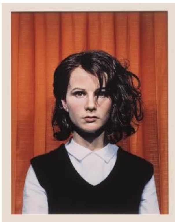
Self Portrait at 17 Years Old , 2003 C-Print 115,5 x 92 cm Colección Fundación 'La Caixa', Barcelona © de la artista, cortesía de Maureen Paley, Londres