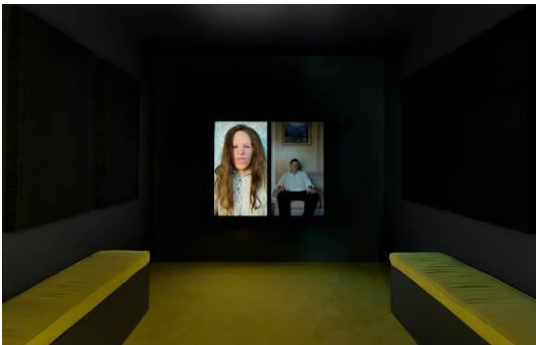
Fear and Loathing , 2014

anteriores como la videoinstalación Secrets and Lies (2009) en la que un conjunto de hombres y mujeres, con disfraces y máscaras, describen de forma anónima experiencias personales delicadas. En el vídeo la artista explora las conductas sociales de personajes anónimos, invadiendo una parcela infranqueable de la personalidad gracias al disfraz bajo el que ocultan su identidad real, lo que les permite expresarse con libertad, sin miedos o