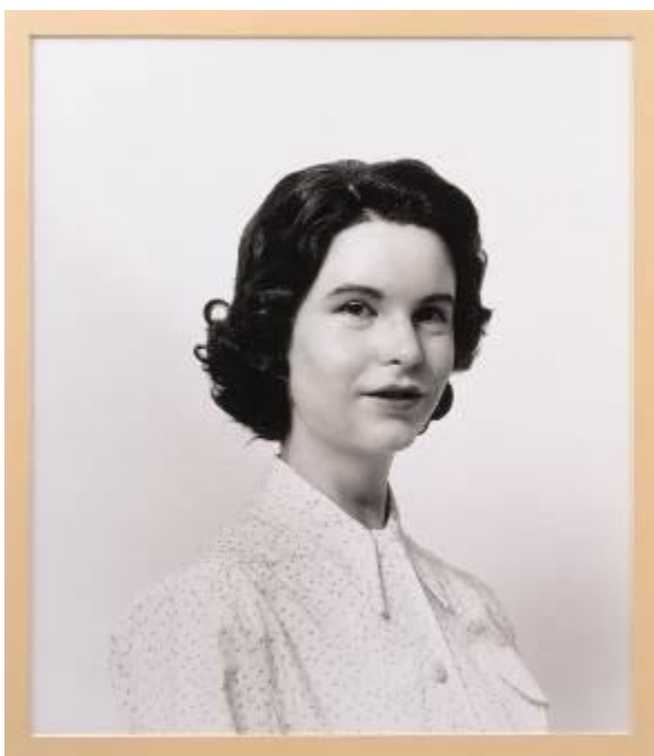
Self Portrait as my mother Jean Gregory, 2003 C-Print 115,5 x 92 cm Colección Fundación 'La Caixa', Barcelona

Otra inquietud que persigue a Wearing desde sus inicios es el papel de la herencia familiar sobre la propia imagen y las conexiones que van más allá de lo genético. Empleando la reproducción casi mimética de antiguas fotos reales, la artista se recrea a sí misma como su hermano, su padre, su madre e incluso como una versión de sí misma recuperando el aspecto que tenía con 17 años. Estos ejercicios de auto-dramatización permiten a la fotógrafa jugar con la idea de que las épocas y las generaciones se funden y la cercanía y la distancia se disuelven.