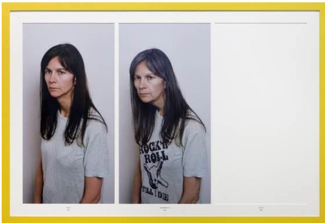
Rock 'n' Roll 70 , 2015

La exposición que el IVAM inaugura el 24 de septiembre es la primera muestra individual en España de Gillian Wearing desde el año 2001. La mayor parte de las obras que la integran pertenecen a los últimos 15 años de creación de la artista británica premio Turner 1997, que estará en Valencia para la inauguración. Fotografías como Rock "n" Roll 70 o la videoinstalación titulada Your Views son de este mismo año y no se han exhibido hasta ahora.