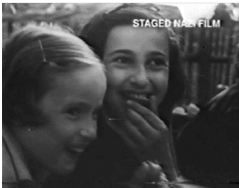
Theresienstadt. El Führer da una ciudad a los judíos, Gobierno alemán, 1944

Les docuficcions, els documentals falsos, busquen desemmascarar els formats d'autoritat , utilitzant les tècniques, codis i convencions del documental per aparentar ser Aquest, desafiant la seua tradicional posició com a instrument que reflecteix la realitat i suggerint la impossibilitat de la imatge per a garantir la veritat de el que reflecteix. I naturalment, per riure d'aquells que creuen en mites i que han oblidat la faula original de la qual van sorgir. En definitiva, exhumar la veritat, desenterrar i veure la mal olor.