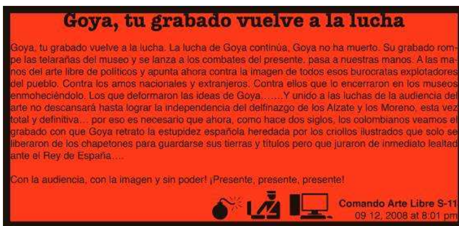
Lucas Ospina , Comando Arte Libre S-11, Bogotá, 2008

Infiltrar-se per dinamitar les coses des de dins. Teatralitzar les teues accions perquè no es distingeixen de les dels altres. Parasitar. Mimetitzar els codis del territori enemic. Camuflar-te en la massa de sons perquè no s'escolte el tic-tac. Somriure entre els pallassos per treure totes les rialles d'un sol cop. Si un home perseguit pels qui pretenen assassinar-lo fica per un carrer lateral, torna immediatament, i avança amb perfecta calma cap als seus perseguidors, o es barreja amb ells i sembla lliurat a la persecució, amb seguretat es tornarà invisible i pot actuar. Camuflatge: enlluernar, vetllar, flaix.