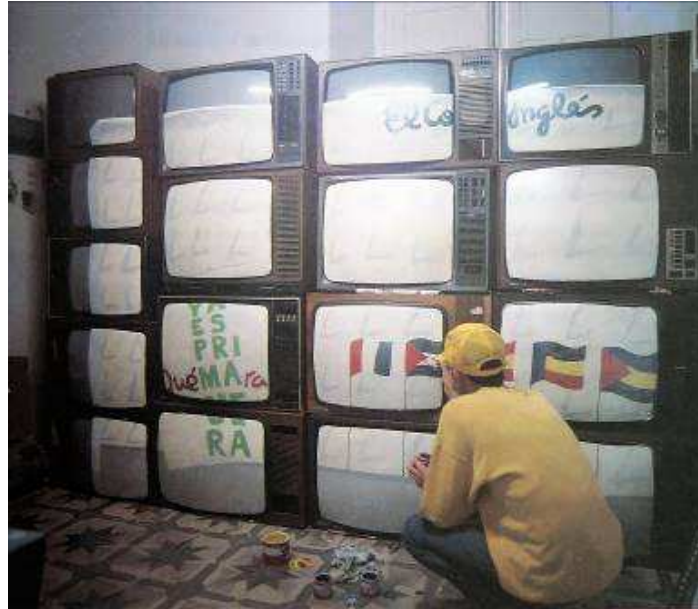
Agustín Parejo School , Lenin Cumbe, Sevilla, 1992

hipoteca de l'autenticitat i l'originalitat imposada per la seva pròpia biografia i la que li imposa el mercat.