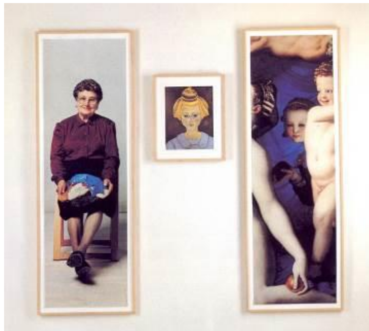
Perejaume Tres vailetes (tríptic), 1993 Fotografia Tríptico | 176 x 59 cm. (x2) | 52,5 x 42,5 cm. (x1) Depósito Cal Cego (IVAM)