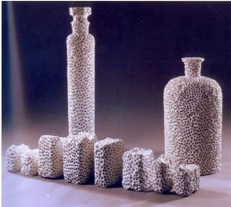
Tony Cragg Forminifera, 990 Instalación 168 x 116 x 137 cm. (10 piezas) Depósito Cal Cego (IVAM)