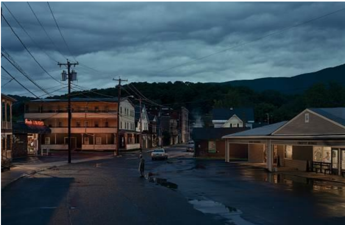
Gregory Crewdson Untitled (Oasis), 2004 Fotografía | C-print 164 x 240 cm Depósito Cal Cego (IVAM)

Gregory Crewdson (Brooklyn, 1962). A los diez años, una visita con su padre a una exposición de Diane Arbus en el MoMA, influyó en su decisión de ser fotógrafo. Famoso por sus imágenes surrealistas de estética cinematográfica, Crewdson retrata hogares y vecindarios de su país a través de una escenificación muy elaborada. Graduado en la Suny Purchase y en la Escuela de Arte de Yale, sus fotografías se caracterizan por capturar momentos aislados, escenas insólitas, que parecen formar parte de una narración, pero en los que para el espectador es difícil adivinar su desarrollo. Sus obras forman parte de las colecciones de los museos de mayor renombre, entre ellos el Whitney o el MoMa de Nueva York.