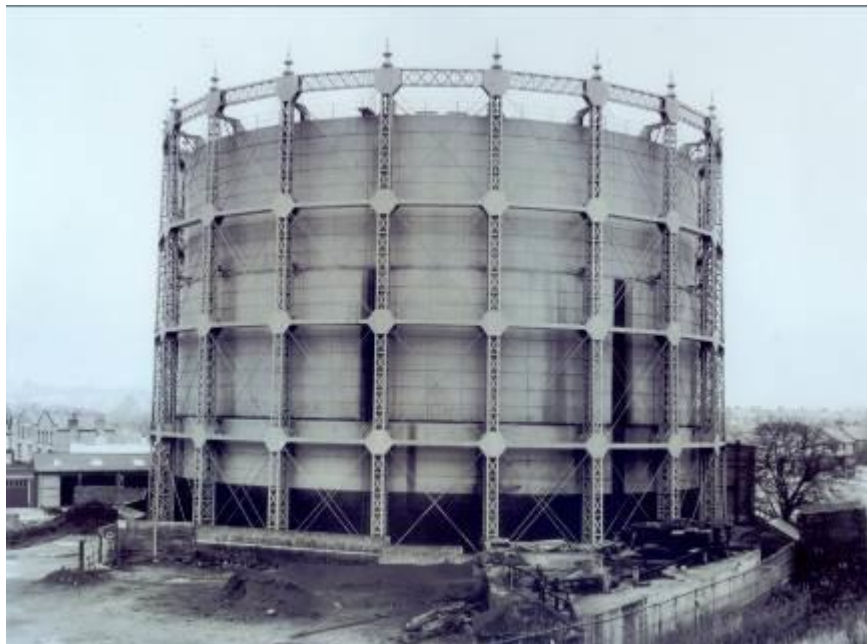
Bern & Hilla Becher Industrienbauten N°1, 2003 Fotografía | Bromuro de plata 29,5 x 39,5 cm Depósito Cal Cego (IVAM)