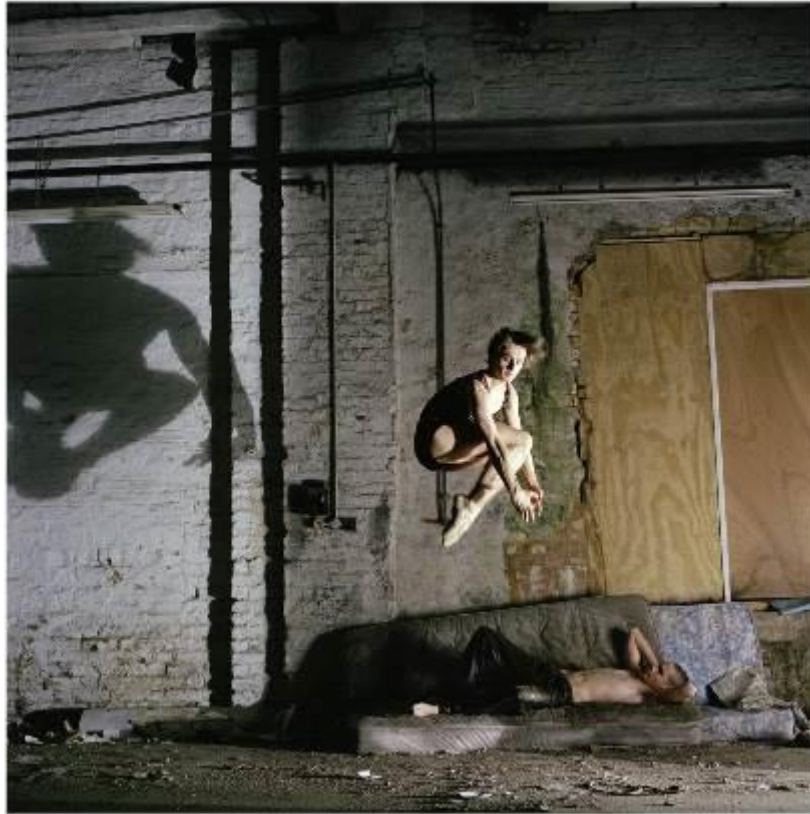
Sam Taylor Wood Ivan, 2004 C-type photography 80 x 70 cm Depósito Juan Redón (IVAM)

A continuació adjuntamos una selecció de una docena de obres de los tres depósitos. Las imágenes en alta resolución pueden solicitarse al Departamento de Comunicación del IVAM.