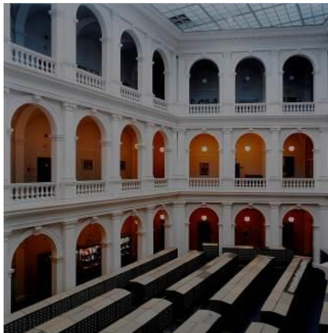
Candida Höfer Staatsbibliothek, 2000 Fotografía | C-print 155 x 155 cm. Depósito Cal Cego (IVAM)