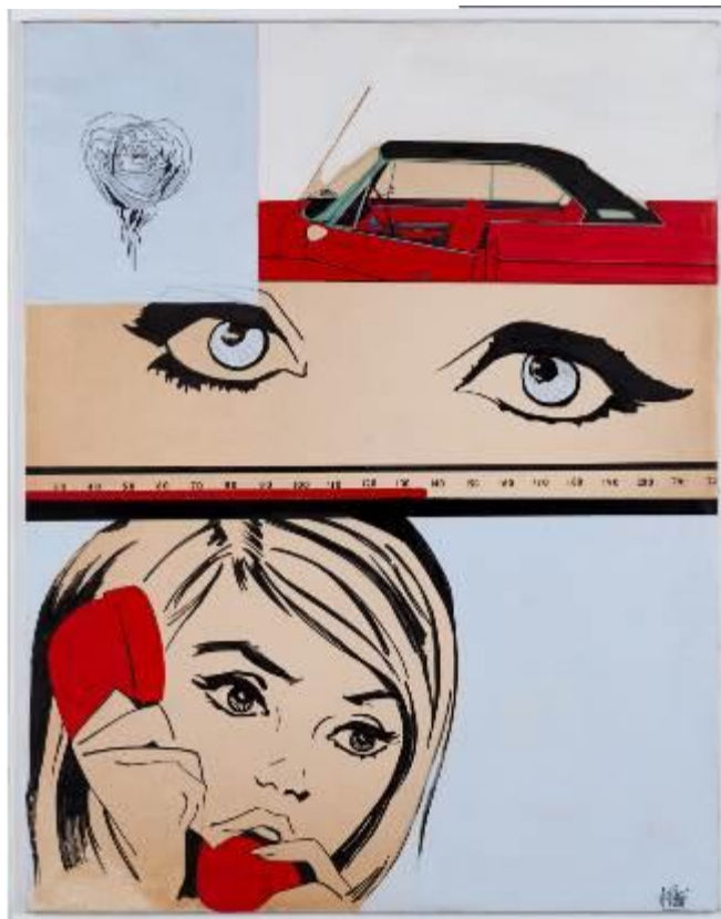
Ana Peters Cuentaquilómetros 1. Rosa Azul, 1966 Acrílico sobre papel encolado a táblex 130 x 100 cm Depósito Herederos Ana Peters (IVAM)