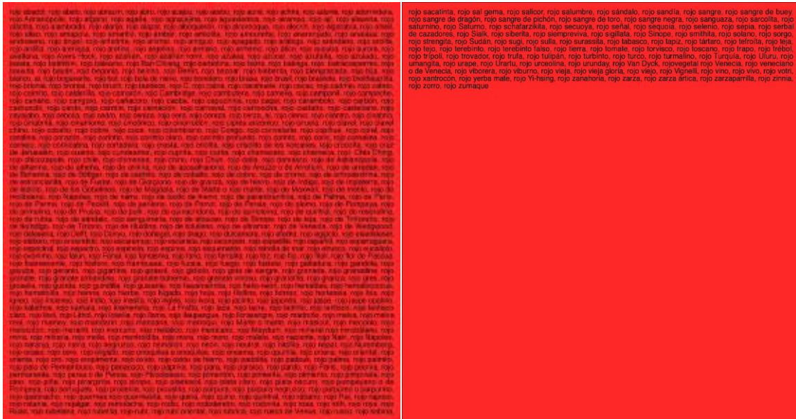
Ignasi Aballí Classificats (vermell), 2007 Díptico. Acrílico y vinilo sobre tela 190 x 200 cm Depósito Cal Cego (IVAM)

Ignasi Aballí (Barcelona 1958) estudió Bellas Artes en Barcelona. Conocido por sus collages y por el uso de la palabra escrita como elemento plástico, se caracteriza por su atención a los elementos más imperceptibles de la realidad. Durante sus más de 30 años de carrera, su obra se ha caracterizado por los continuos y renovados cambios de estilo, formato y material para acercarse al arte conceptual, aunque en su proceso de creación ha mantenido presentes el azar, la ausencia o la obsolescencia. En 2015 fue el primer artista español en recibir el premio Joan Miró. Ha expuesto en museos nacionales e internacionales como el MACBA, el Reina Sofía, la Fundación Serralves (Oporto) o la Ikon Gallery (Birmingham).