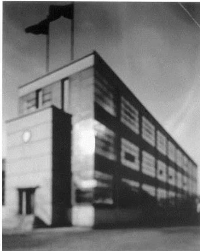
Hiroshi Sugimoto Fagus Schulheistenfabrik – W. Gropius and A. Meyer, 1998 Fotografia | Gelatina de bromuro de plata 63,5 x 50,8 cm. Depósito Cal Cego (IVAM)