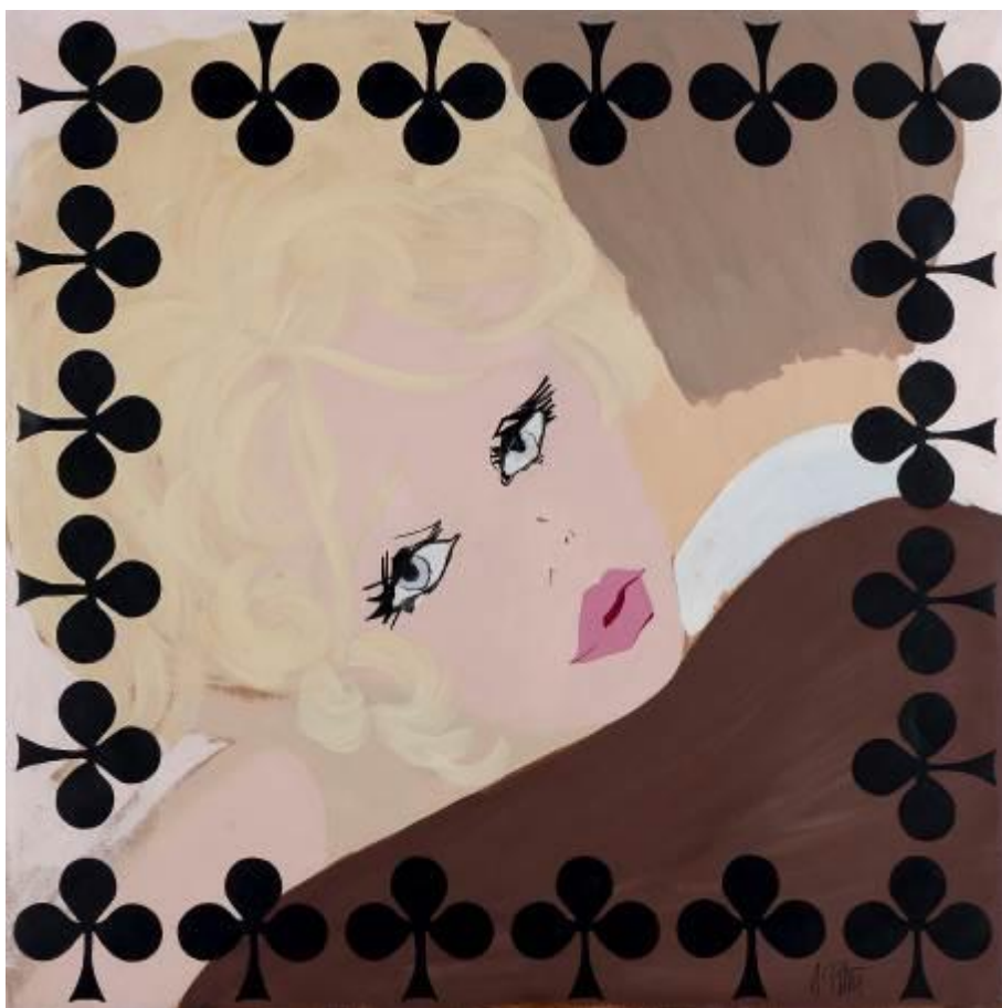
Ana Peters Trébol, s/f 100 x 130 cm Depósito Herederos Ana Peters (IVAM)

El tercer depósito está compuesto por 16 obras de Ana Peters (1932 Bremen–2012 Denia), pertenecientes a sus herederos. Se trata de pinturas figurativas de los años 60, de los inicios de la carrera de la artista alemana afincada en España, que vienen a completar la colección del IVAM, que hasta ahora contaba entre sus fondos con 16 trabajos, la mayoría de ellos de la última etapa de la vida de Peters. Las nuevas obras, muchas de ellas relacionadas con el arte pop, van a estar presentes en la próxima exposición Caso de estudio: Ana Peters , que se inaugurará en el próximo 23 de julio en la Galería 3 del IVAM. Se trata de obras como Gula (s/f) , Trébol (s/f) o La envidia (1965) .