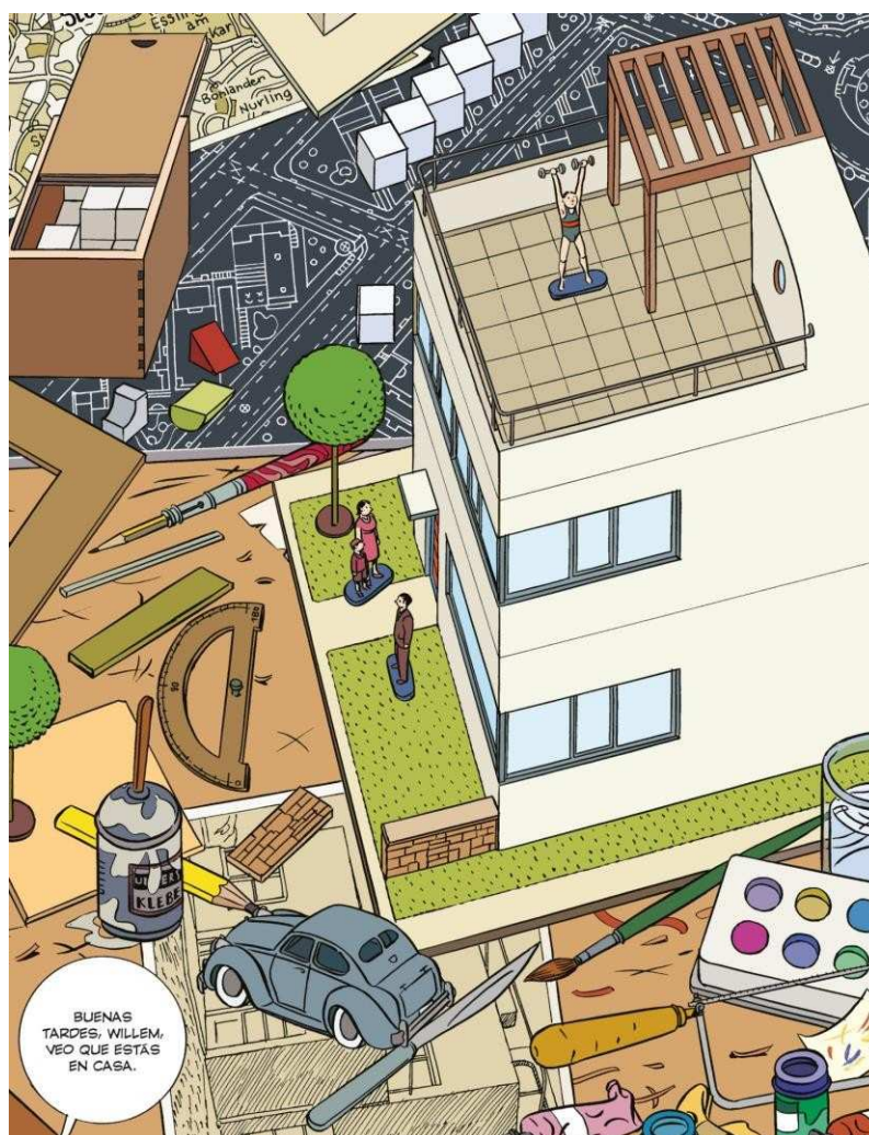
La casa. Crónica de una conquista , 2015. Fragmento pág. 449. Daniel Torres